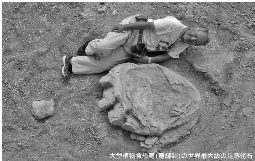
大型植物食恐竜(竜脚類)の世界最大級の足跡化石

文部科学省の2016年度「私立大学研究ブランディング事業」に、本学の恐竜研究拠点形成が採択されました。5年間にわたって国の支援を受け、モンゴル科学アカデミーと協力しながら、「恐竜の理大」を目指して研究・開発に取り組んでいます。