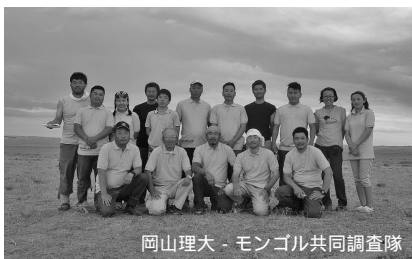
岡山理大 - モンゴル共同調査隊